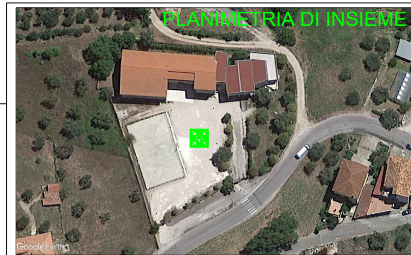
PLANIMETRIA DI INSIEME

-Mantenere la calma: non lasciarsi prendere dal panico -Trovare luoghi di riparo da oggetti in caduta libera senza creare confusione: sotto il banco o addossati alla parete, lontano da finestre ed armadi Dopo la scossa, all'ordine di evacuazione, abbandonare ordinatamente l'ambiente seguendo le procedure di evacuazione previste